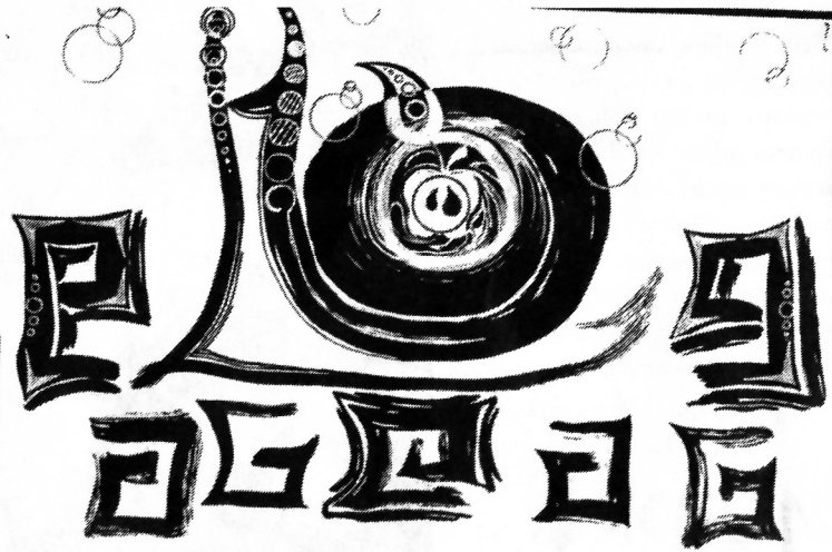
Рисунки: Мария Круглова